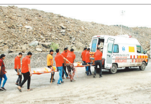
माँकड़िल करते हुए।

10 जुलाई समय 4 बजे एसईसीएल गेवरा खदान के व्यू पॉइंट पर सीआईएसएफ द्वारा एसईसीएल और विभिन्न रेस्क्यू एजेंसियों के साथ मेगा माँकड़िल इस का संयुक्त अभ्यास किया गया। इस अभ्यास का उद्देश्य आपदा प्रबंधन क्षमता को परखना और विभिन्न एजेंसियों के बीच समन्वय स्थापित करना