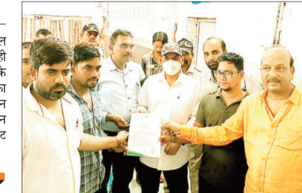
ज्ञान सौंपते पार्षद एवं अन्य।

इस दौरान प्राइवेट मरीजों के लिये एम्बुलेंस की सुविधा देने, उचित इलाज प्रदान करने एवं दवाई खरीदी में कमीशनखोरी बंद करने की मांग को लेकर सीएमएचओ एसईसीएल बांकी मोंगरा को ज्ञान सौंपकर उचित कार्यवाही की मांग की गई। साथ ही मांगे पूरी नहीं होने