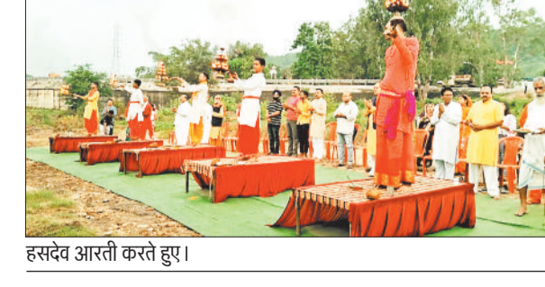
हसदेव आरती करते हुए।

आषाढ़ पूर्णिमा (गुरु पूर्णिमा) के शुभ अवसर पर नमामि हसदेव सेवा समिति द्वारा मां सर्वमंगला घाट कोरबा पर हसदेव आरती का आयोजन 10 जुलाई को सायं 5 बजे से किया गया। इस अवसर पर समिति द्वारा बड़ी संख्या में उपस्थित भक्तों के लिये यथोचित व्यवस्था की गयी थी। इस संबंध में विस्तृत जानकारी देते हुए नमामि हसदेव सेवा समिति द्वारा बताया गया कि समिति द्वारा हसदेव नदी, हसदेव की सहायक नदियों और अन्य प्राकृतिक जल स्रोतों के