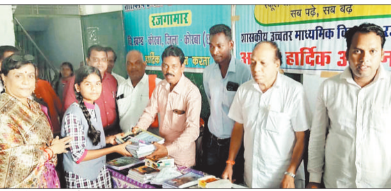
बच्चों को पाठ्य सामग्री का वितरण करते हुए।