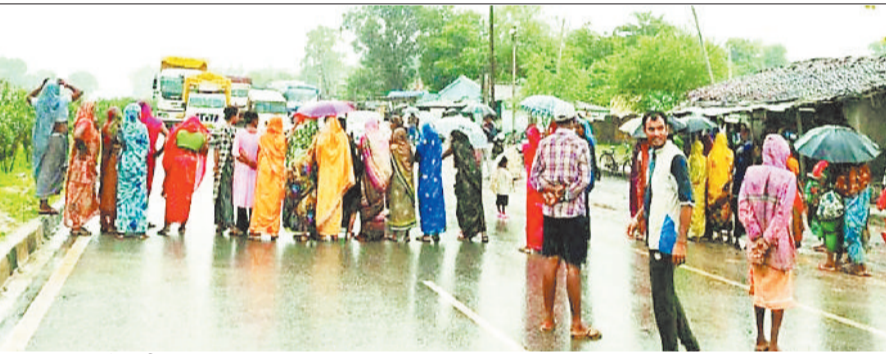
चक्काजाम करते ग्रामीण।