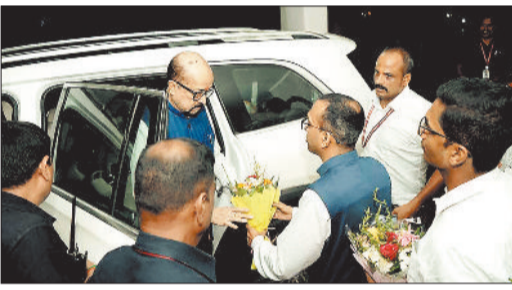
राज्यपाल का स्वागत करते कलेक्टर एवं अन्य।

डेका बीते चार माह के दौरान दूसरी बार कोरबा प्रवास पर आ रहे हैं। इससे पूर्व अप्रैल माह में उन्होंने अपने कोरबा प्रवास के दौरान पर्यटन केंद्र बुका का अवलोकन करने के साथ क्षेत्र में पर्यटन की असीम संभावनाएं के संबंध में बातें कहीं थीं और कलेक्टर के विभागीय अधिकारियों की बैठक लेकर केंद्रीय योजनाओं की समीक्षा करने के साथ कोरबा ब्लॉक के करमोहा ग्राम पंचायत का दौरा कर वहां के ग्रामीणों से मुलाकात करने के साथ पीएम आवास के हितग्राहियों से भी चर्चा की थी। दूसरी बार प्रवास पर आ रहे राज्यपाल रमन डेका शनिवार को कलेक्टर के एक पेड़ मां के नाम